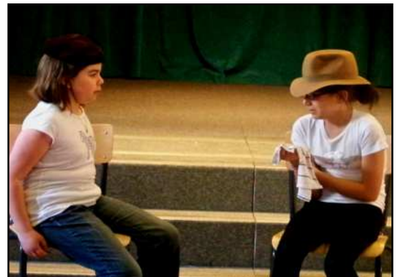
La Lionne et l'Ourse