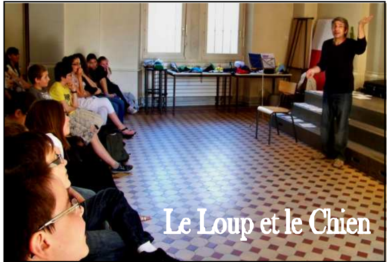
Le Loup et le Chien