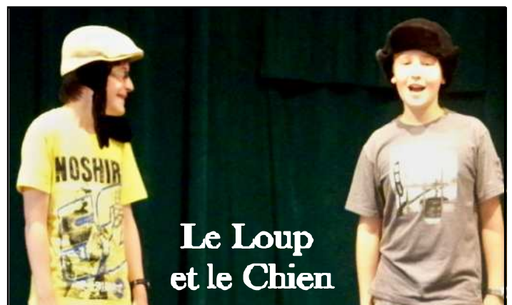
Le Loup et le Chien