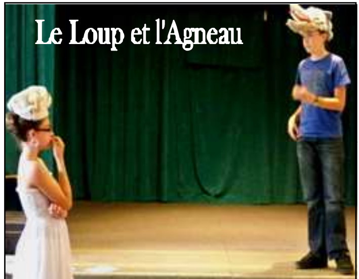
Le Loup et l'Agneau