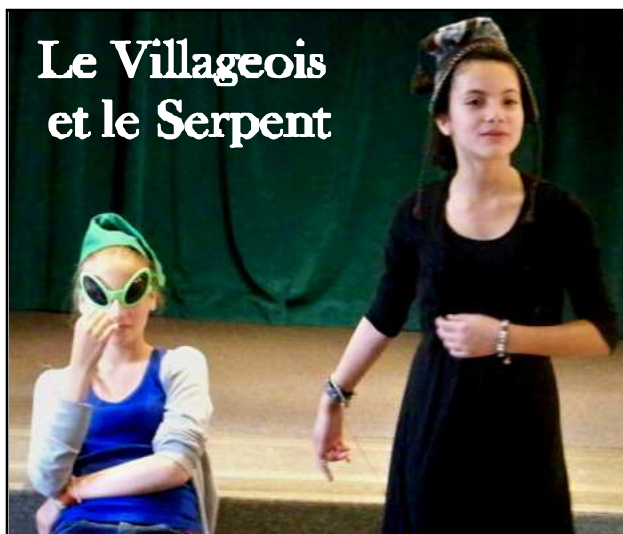
Le Villageois et le Serpent