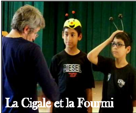
La Cigale et la Fourmi