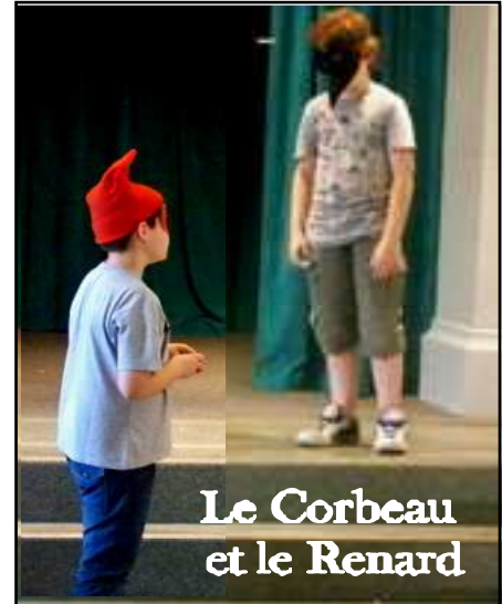
Le Corbeau et le Renard