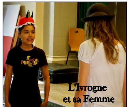
L'Ivrogne et sa Femme