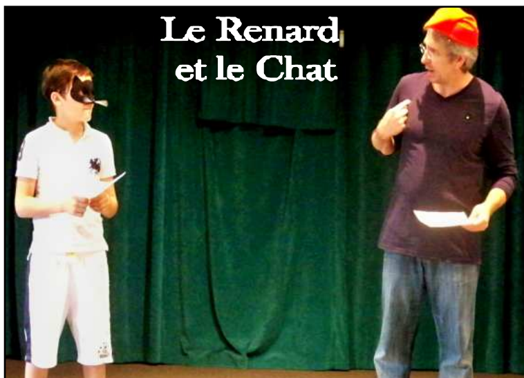
Le Renard et le Chat